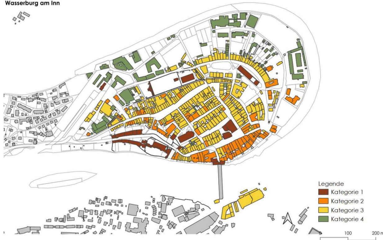
Übersichtskarte der Kategorien in der Altstadt von Wasserburg am Inn